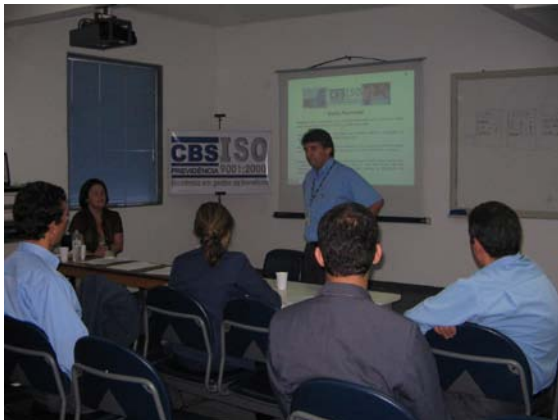
Importância do cadastro