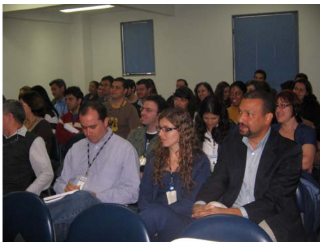
Controle de Risco