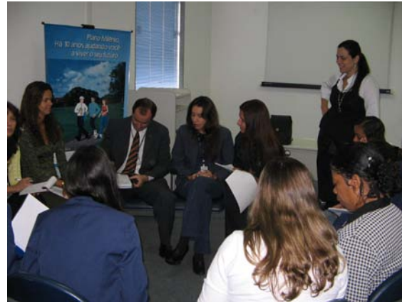
Importância da Gestão de Riscos