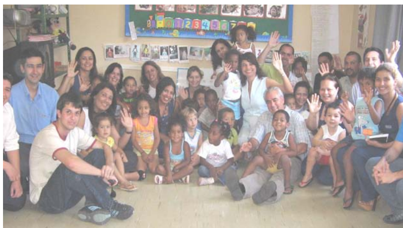
Creche Santa Cecília, em outubro 2007

Em outubro de 2007, na comemoração pelo Dia das Crianças, foi realizada uma visita à instituição, com a participação de um grupo de profissionais da CBS Previdência.